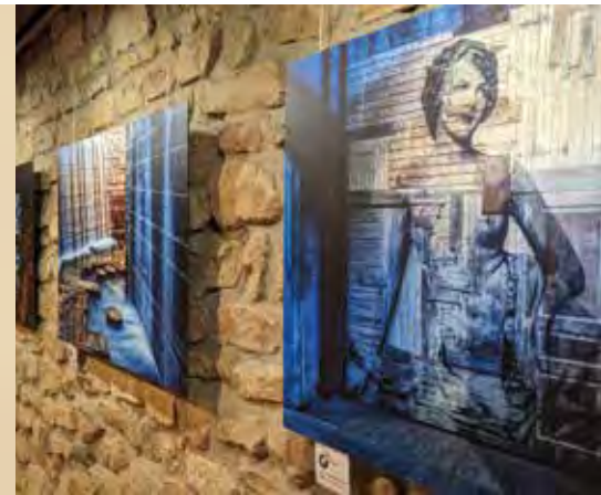
4. & 5. Ausstellungsarbeiten der Mitglieder des Berufsverbandes Handwerk Kunst Design e.V.