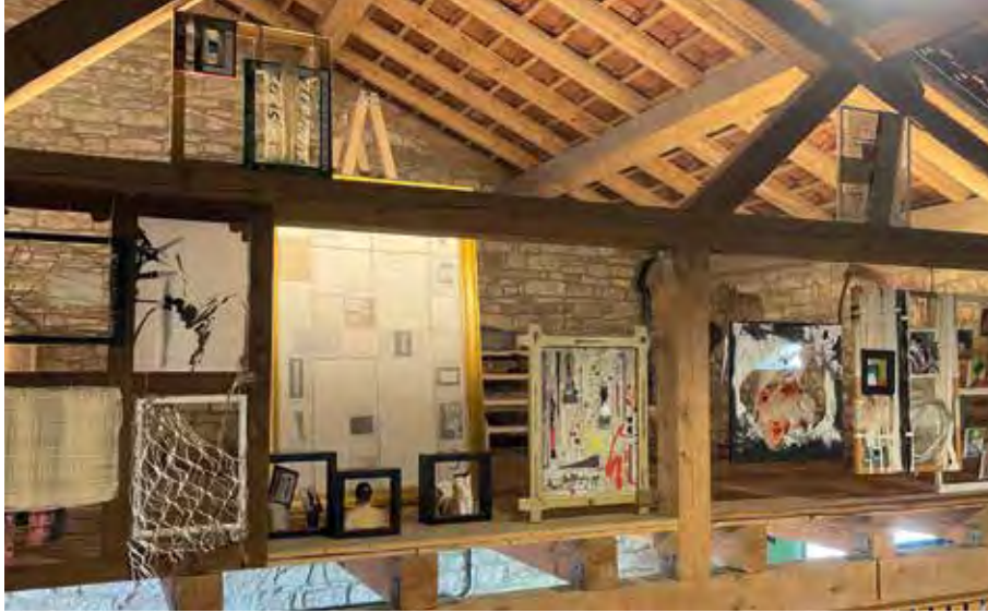
Foto: „Im Rahmen“ – Impression der Gruppenausstellung 2024, Kunst Forum Saarlouis