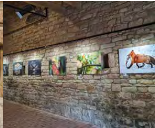
1. Gemeinschaftsarbeit Kunstforum Saarlouis (2024), 2. Skulptur Saarpolygon Marianne Feld, 3. & 6. Fotografie Objektiv VSE (2024)