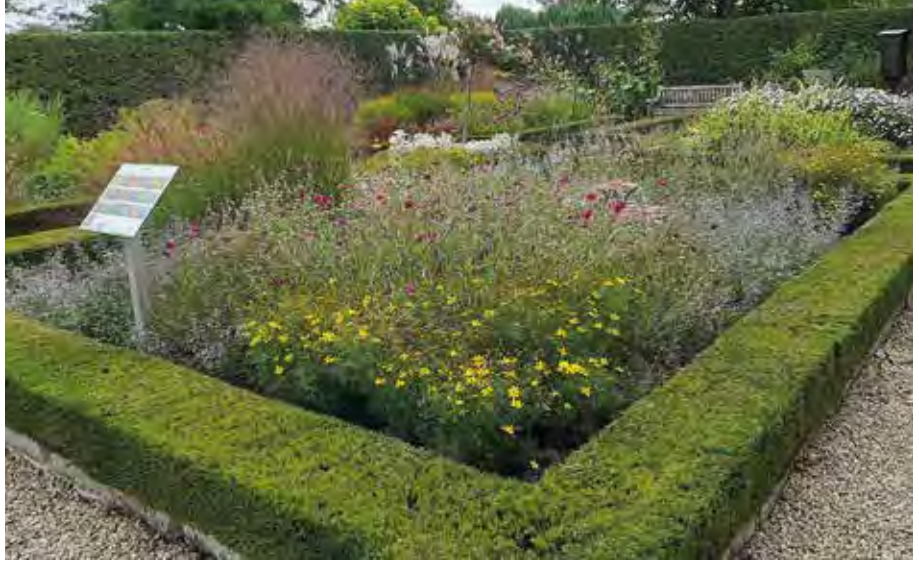
Staudenmischung „Farbenspiel“

DER DUFT- UND WÜRZGARTEN & OBSTWIESE AM HAUS SAARGAU