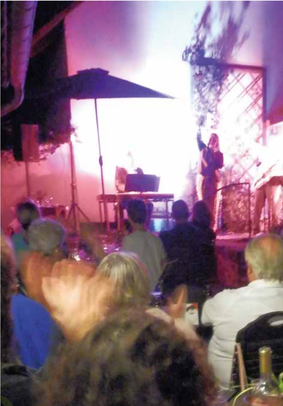
Jazzabend mit dem Herry Schmitt Trio im Garten des Haus Saargau